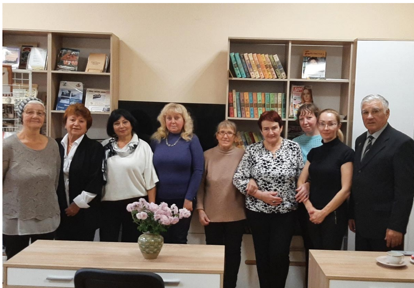
За чашкой ароматного чая время пролетело стремительно. Казалось, уже все встречи обсудили и